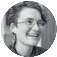
| Ariane CHAPELET Scénographie